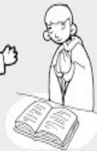
Oración de los fieles