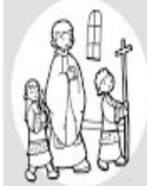
Procesión de entrada