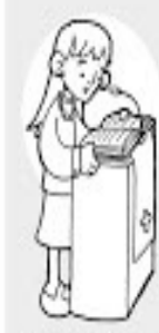
Lecturas y salmo